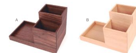
HX499 ペンスタンド □