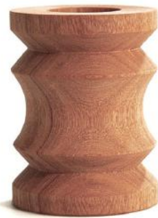
HX576 ペンポット C - タモ □