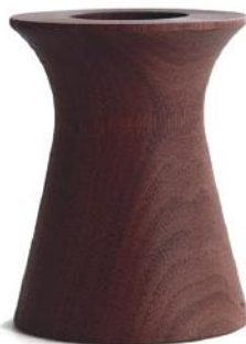
HX575 ペンポット B - ウォールナット □