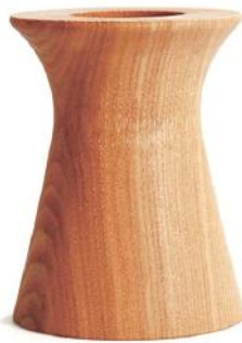
HX574 ペンポット B - タモ □