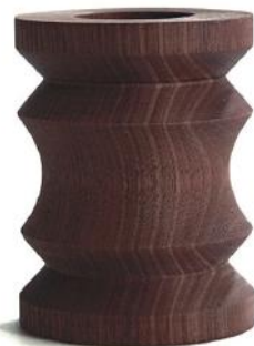
HX577 ペンポット C - ウォールナット □