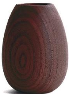
HX573 ペンポット A - ウォールナット □