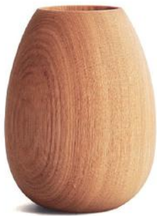
HX572 ペンポット A - タモ □